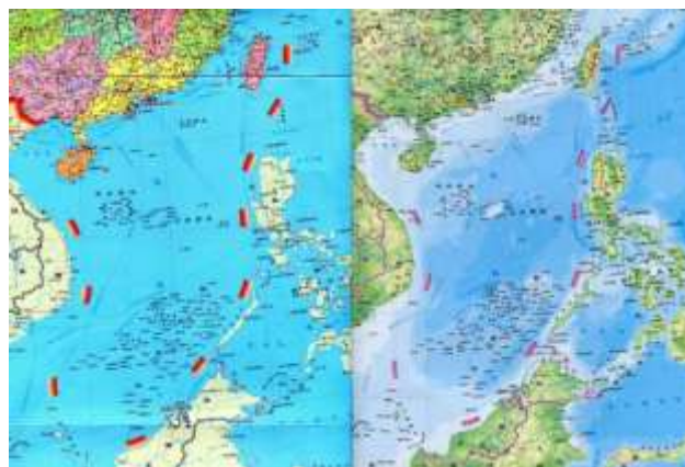
Gambar 1. Peta Ten-Dash Line

Meskipun berbagai studi telah mengkaji aspek geopolitik, ekonomi, dan militer di Laut China Selatan, terdapat kesenjangan penelitian yang signifikan terkait peran diplomasi maritim, khususnya strategi yang diterapkan oleh TNI Angkatan Laut dalam membangun kepercayaan dan stabilitas di kawasan ini. Penelitian sebelumnya lebih banyak berfokus pada analisis konflik wilayah dan dampaknya terhadap ekonomi global, namun belum banyak yang mendalami bagaimana diplomasi militer dapat menjadi instrumen efektif dalam meredakan ketegangan dan memperkuat kerjasama antarnegara (Council on Foreign Relations, 2025).